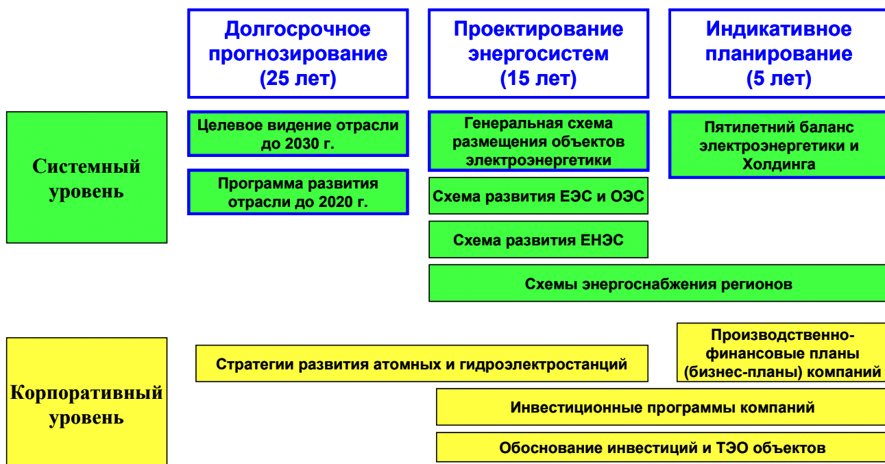
Рисунок 3 – Состав выполняемых основных работ по прогнозно-проектному обеспечению инвестиционной деятельности в электроэнергетике.

1). В рамках этапа долгосрочного прогнозирования по инициативе РАО «ЕЭС России» и при активном участии Российской академии наук разработано «Целевое видение (стратегия) развития ЕЭС России до 2030 г.». Задачей этой работы стала попытка сформировать целостное представление о системе стратегических вызовов, с которыми столкнется отрасль в первой трети 21 века, оценить масштабы развития, темпы и возможности перехода на новые технологические уровни в генерации и передаче электроэнергии [2, 3]. По заказу Минпромэнерго РФ разработана Программа развития электроэнергетики России на период до 2020 года. В 2007 г. начата работа по корректировке Энергетической стратегии страны.