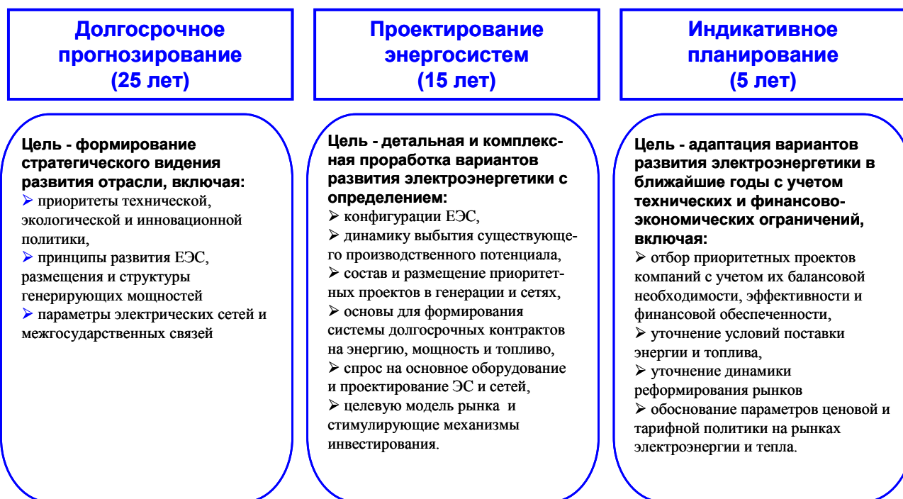
Рисунок 1 - Этапы прогнозирования и проектирования развития электроэнергетики

2). Этап проектирования энергосистем на перспективу до 15 лет , которая в рамках заданной системы инвестиционных приоритетов определяет варианты надёжного и эффективного развития электроэнергетики при заданных сценариях развития экономики страны и регионов. Цель - детальная и комплексная проработка вариантов развития электроэнергетики, включая определение конфигурации ЕЭС России, динамики физического и морального износа существующего производственного потенциала отрасли, формирования состава потенциальных предложений для инвесторов в генерации и сетях, параметров долгосрочных контрактов на экспорт/импорт электроэнергии и мощности и долгосрочных контрактов на поставки топлива для электростанций, заказов на основное оборудование и проектирование ЭС и сетей, целевой модели рынка электроэнергии и стимулирующих механизмов инвестирования.